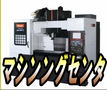
マシニングセンタ